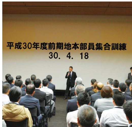
平成30年度前期地本部員集合訓練 30. 4. 18

長崎地本は、4月18日(水)、平成30年度前期地本部員集合訓練を実施しました。本訓練は、「地本部員としての職能向上を図る」を目的とし、長崎地本の全部員が集合して年2回実施しているものです。